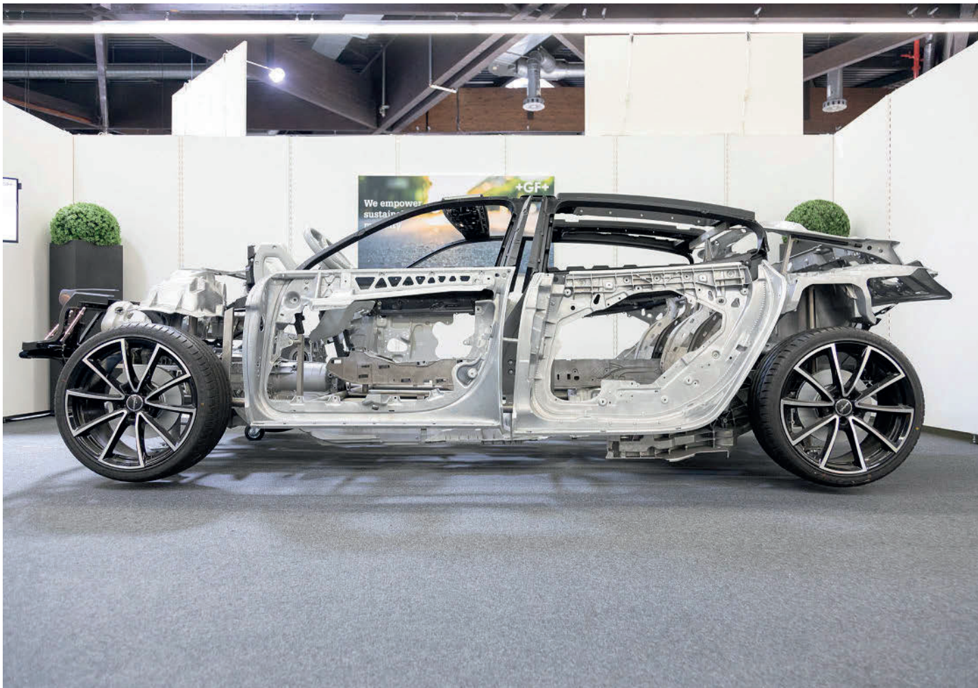
GF Casting Solutions zeigte seine Kompetenz in Sachen Leichtmetallbau für Automobilhersteller. Das hier ausstellte Showcar für Renault ist ein Hybrid-Konzept mit einem von GF gefertigten Batteriegehäuse.