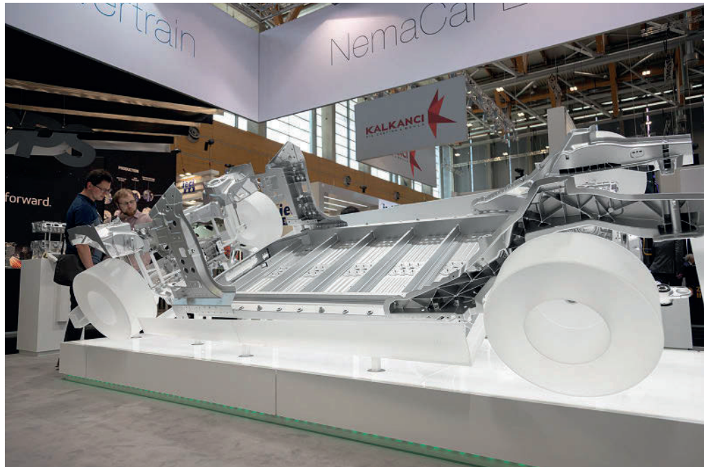
Das „NemaCar E-Light“, die Aluminium-Karosserie des Mercedes EQS.

B eschwingt startete man dennoch in das größte Branchentreffen des Jahres – die lauen Temperaturen machten es möglich, dass die traditionelle Eröffnungsfeier auf der Nürnberger Kaiserburg in diesem Jahr als Open-Air-Event ausgetragen wurde. Bei Jazz-Klängen und Grillgut gab es ein erstes Stelldichein der Branchenvertreter, die allesamt froh über das erste große Wiedersehen mit physischer Anwesenheit waren. Clemens Küpper, Präsident des BDG, betonte im Rahmen seiner Eröffnungsrede die Wichtigkeit persönlichen Austausches für die Branche und ihre Produkte, ging aber auch auf die aktuellen Schwierigkeiten wie den Ukraine-Konflikt und die damit verbundenen Herausforderungen ein. In diesem Zuge wurde erneut die Bedeutung politischen Handelns und der Ansprache an die Akteure betont. Dieser Tenor setzte sich dann auch am Fol-