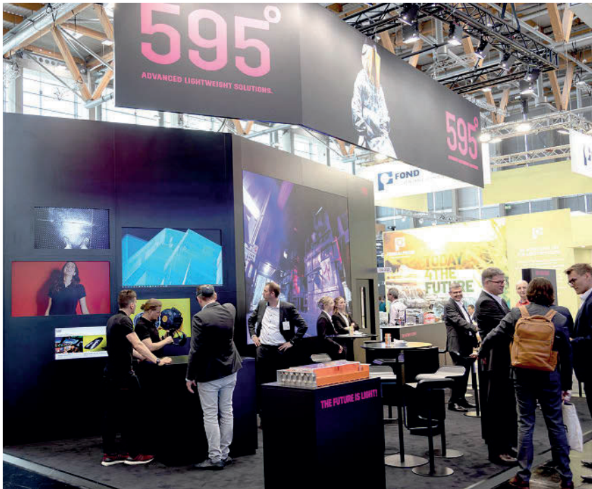
Die ehemalige Gießerei Schulte und Schmidt ist jetzt unter dem Namen 595° Solutions auf dem Markt. Am Messestand konnten Besucher per Virtual Reality einen Blick in die digitalisierte Gießereianlage werfen.